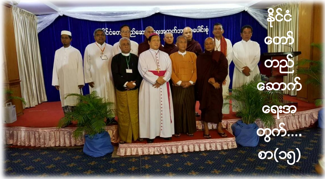
နိုင်ငံ တော် တည် ဆောက် ရေးအ တွက်.... စာ(၁၅)