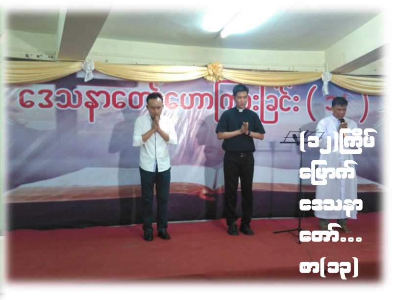
(၁၅)ကြိမ် ဖြောက် ဒေသနာ တော်... စာ(၁၃)