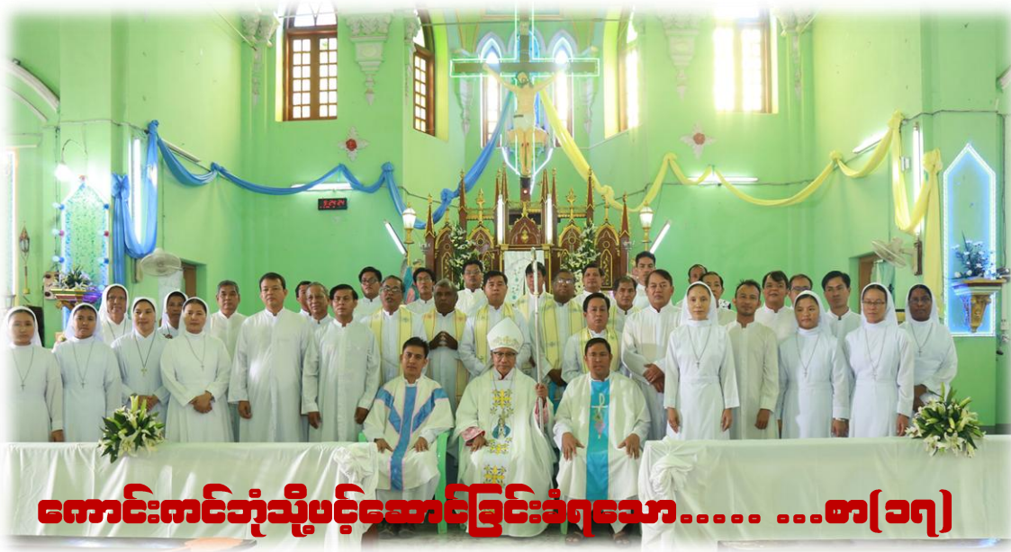
ကောင်းကင်တံ့သို့ပင့်ဆောင်ခြင်းခံရသော..... စာ(၁၇)