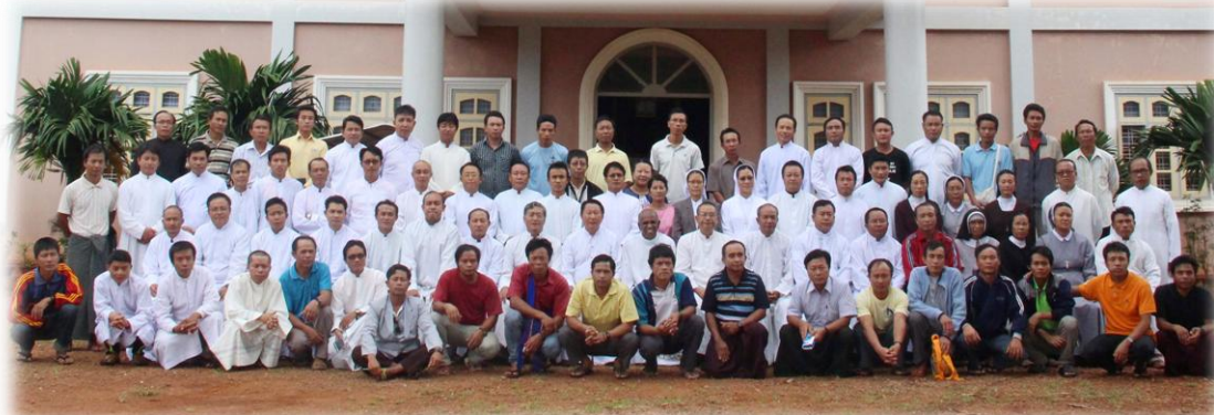
မယ်ခုံသာသနာ၏.....စာ(၁၅)