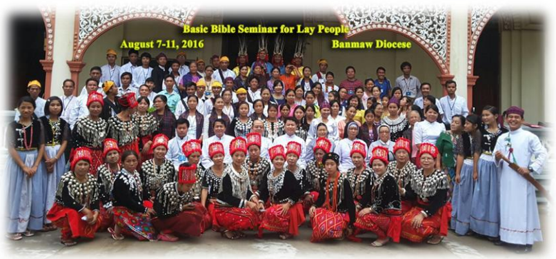
အခြေခံသမ္မာကျမ်းစာ.....စာ(၉)